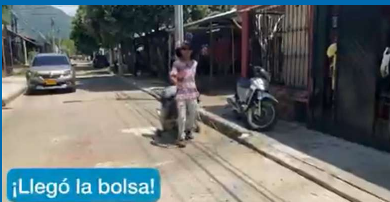
¡Llegó la bolsa!

Es por eso que en el tercer trimestre de 2022 comenzamos a contar las historias de nuestros clientes, para promocionar sus productos y servicios, a través de una sección nombrada 'Historias IFC', que se difunde en las redes sociales de la entidad, y con los medios de comunicación.